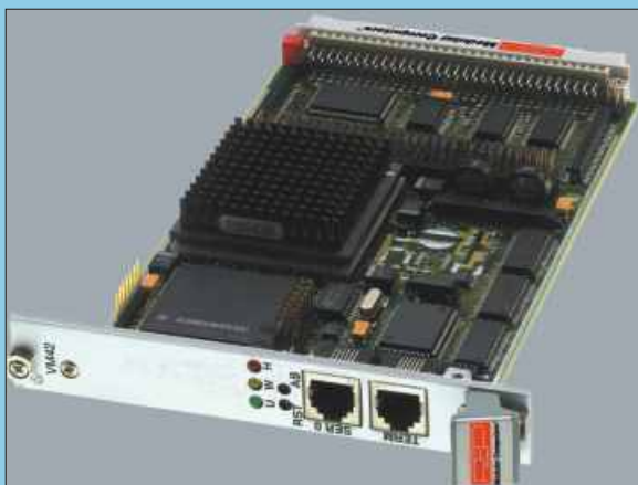
Процессорный модуль VM-42

Подключение кабельных связей осуществляется напрямую от датчиков и исполнительных механизмов, включая сигналы 220В, минуя специальные преобразователи и шкафы-промклеммники.