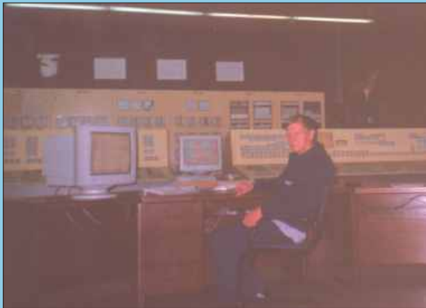
АРМ оператора и АРМ инженера наладчика