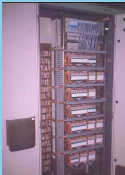
Один из шкафов контроллеров

Модули-носители обеспечивают интерфейс доступа процессорного устройства к функциональным субмодулям. Обработка в контроллере централизована в процессорном устройстве VM42-Base.